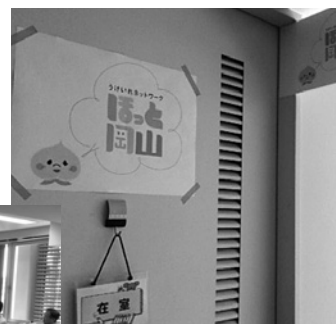
ほっと岡山 避難者相談窓口