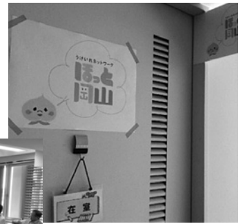
ほっと岡山 避難者相談窓口