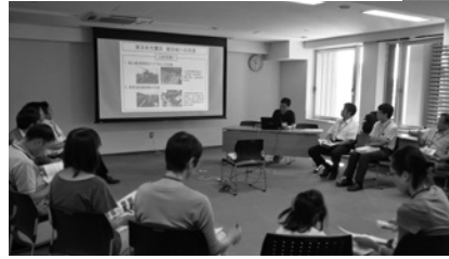
情報説明会・交流会の様子