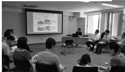
情報説明会・交流会の様子